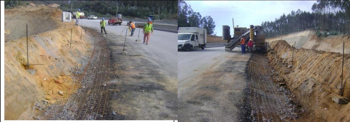
Colocación de Enfierradura de Cunetas Hormigón Tramo A Sector II By Pass de Laraquete Lado Izquierdo km: 43.570 – 43.700.