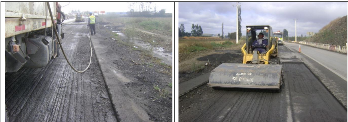
Fresado de Sectores Deteriorados Tramo A Sector II Lado Izq/Der km: 0,138 - 0,198 Eje N°46 Enlace Carampangue.