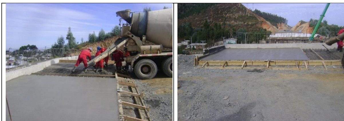
Hormigonado Losa de Acceso Estribo de Entrada Tramo A Sector II Viaducto las Cruces By Pass Laraquete Lado Izq/der km: 44.329,17