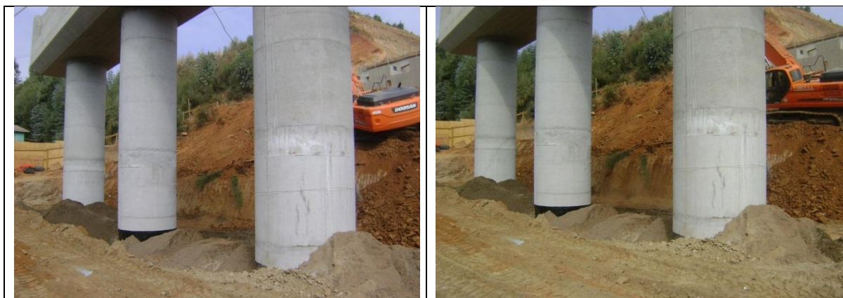
Relleno estructural Pilas 1-2-3 Cepa N° 3 Tramo A Sector II Viaducto las Cruces km: 44.429.