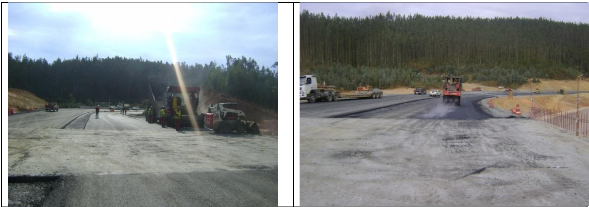
Colocación de Carpeta Asfáltica Tramo A II Sector By Pass Laraquete Lado Derecho km: 43.820 – 43.980.