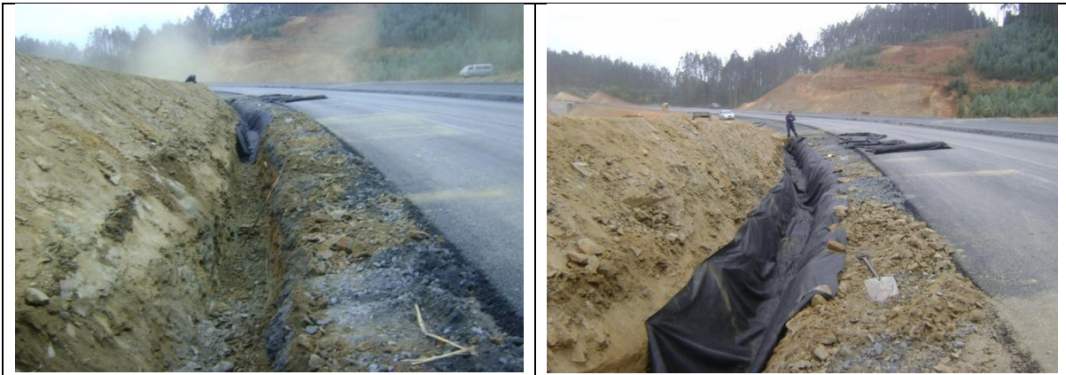
Construcción de Subdrenes Tramo A Sector II By Pass de Carampangue Lado Derecho km: 44.000 – 44.100.