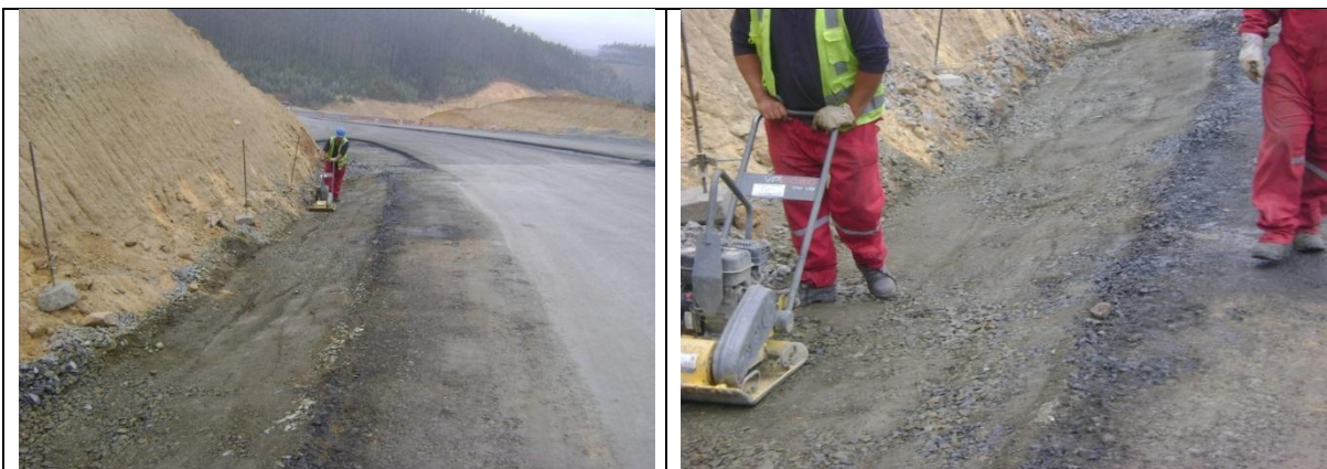
Compactación de Base para Cunetas Hormigón Tramo A Sector II By Pass de Laraquete Lado Izquierdo km: 43.570 – 43.700.