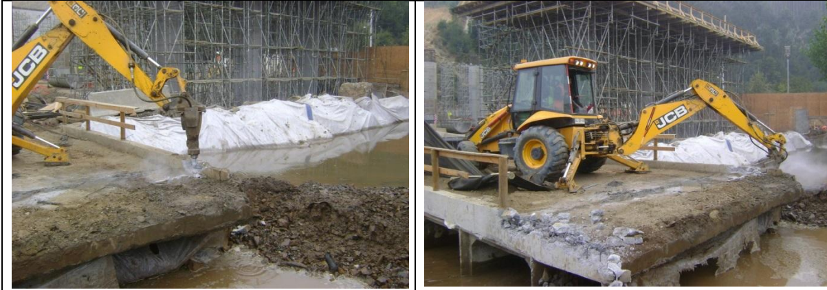
Demolición Losa Puente Provisorio Viaducto las Cruces Tramo A Sector II By Pass de Laraquete Lado derecho km: 44.395.