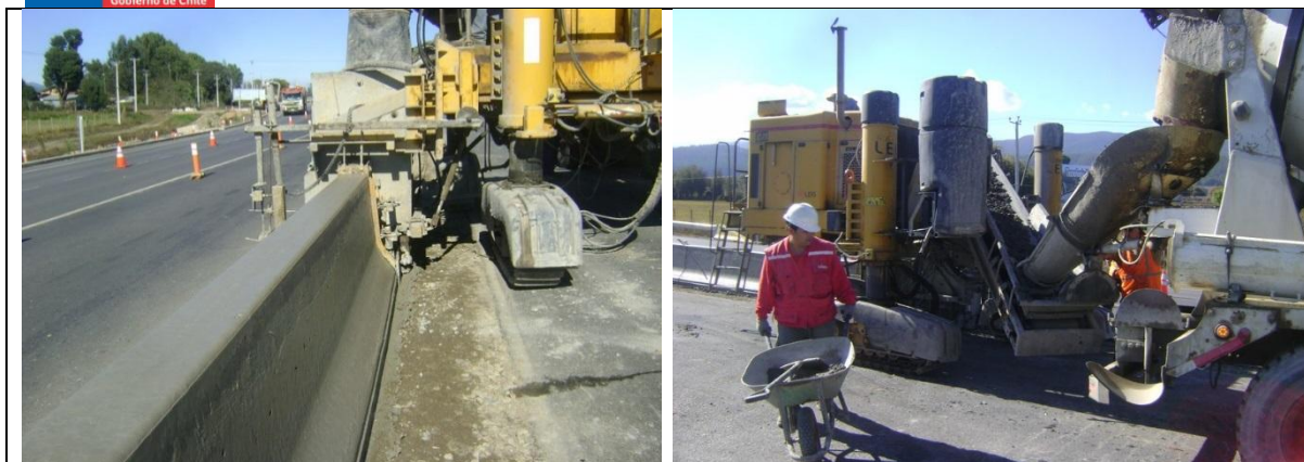
Hormigonado Barrera Tipo F en la Mediana Tramo A Sector II km: 53.460 – 53.590.